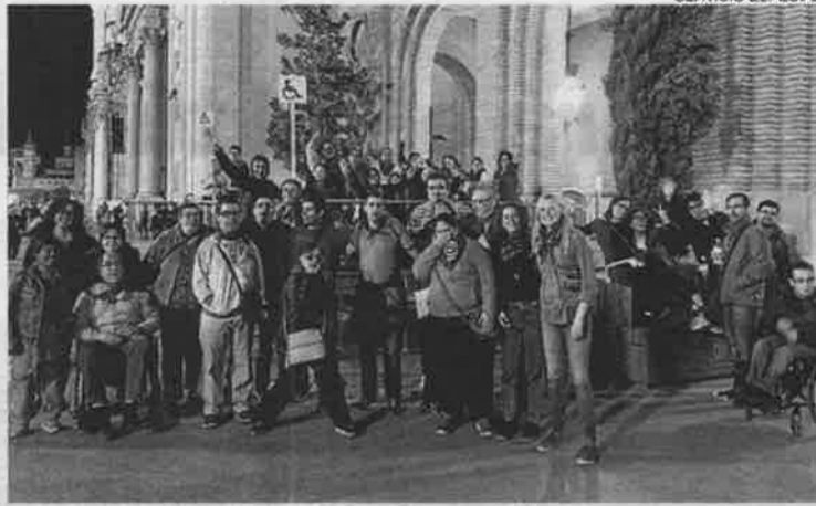
Los chicos y chicas de los centros de DFA en las fiestas del Pilar.

Se habilitaron canales on line y off line de información sobre accesibilidad durante las fiestas (redes sociales, teléfonos, oficina, etc.). En el portal del ayuntamiento podemos encontrar un mapa de la ciudad de Zaragoza con distintos puntos que indican la accesibilidad de cada espacio y qué inclu-