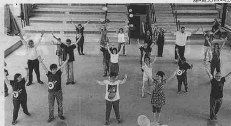
Una de las actividades organizadas por Utrillo el curso pasado.

La entidad ha dado continuidad a algunas de las propuestas del año pasado, incorporando otras nuevas que despiertan la curiosidad, que sean novedosas y, sobre todo, atractivas. Ha tenido también muy presente la idea